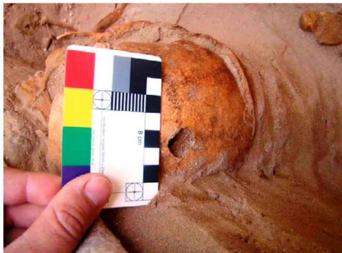
Fig. 4. Cráneo con impacto de proyectil hallado en la fosa común del cementerio de Puerto Real (Fuente: Román y Guijo, 2015).

Hay que destacar, por último, una vez más, la labor educativa realizada recientemente por el movimiento memorialista en los centros de enseñanza secundaria de la ciudad, implicando a los estudiantes en acciones de sensibilización para evitar que el desconocimiento condene a aquellos hechos a un nuevo y lamentable olvido.