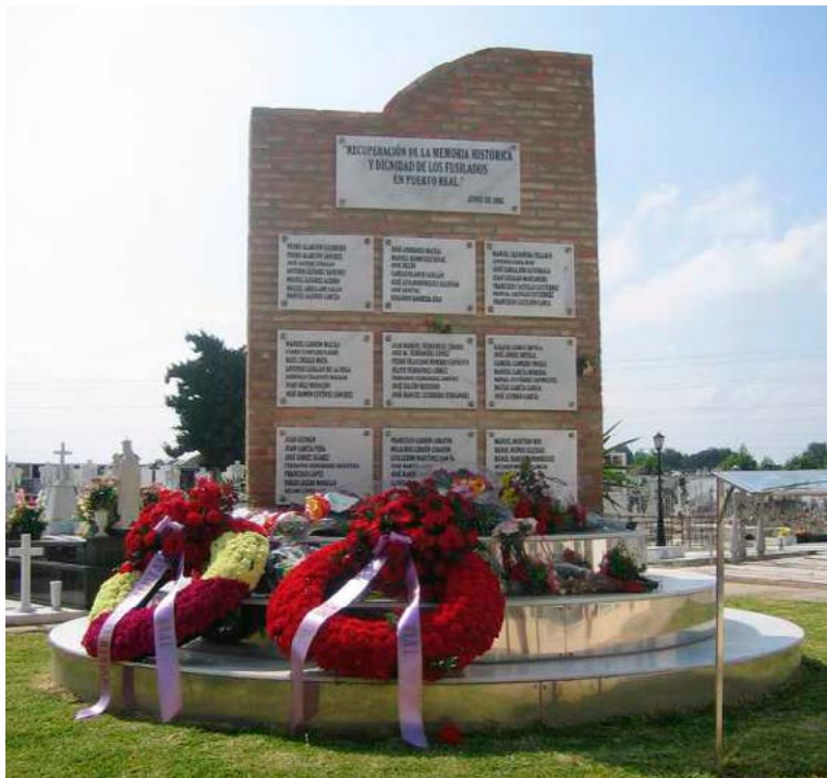
Fig. 3. Monumento a los fusilados en el cementerio de Puerto Real.

Sin embargo, un hito importante fue la inauguración, el 19 de junio de 2005, de un monumento a los fusilados en la Guerra Civil en el cementerio de Puerto Real, a iniciativa del Ayuntamiento y de la Plataforma para la Recuperación de la Memoria Histórica. Una gran bandera republicana cubrió las lápidas con los nombres de todos ellos. El alcalde de Puerto Real, en la alocución que dirigió a los presentes en el acto, afirmó que “al caer esa bandera para dejar a la vista sus nombres, caían con ella setenta años de silencio”.